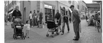
ESENZIONE TICKET PER REDDITO

Il paziente dovrà compilare presso un CAF il modello ISEE